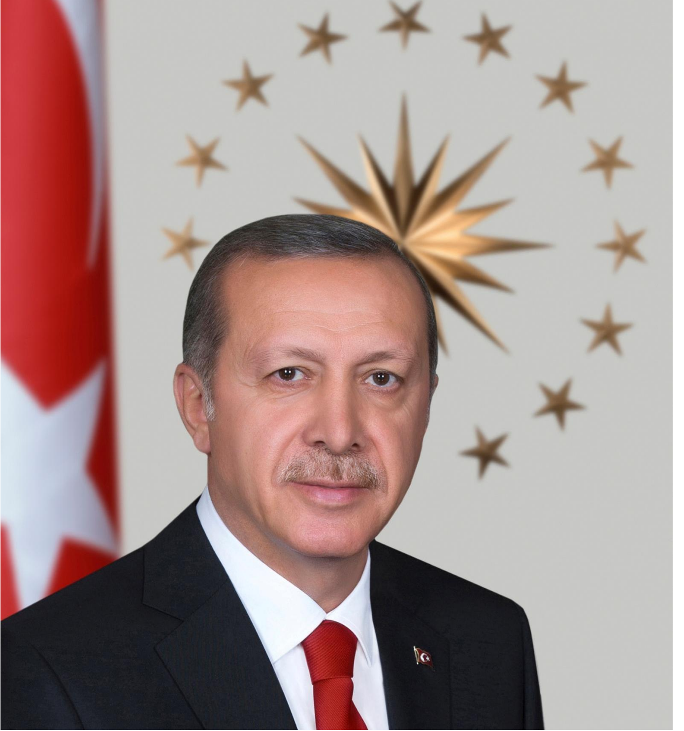
RECEP TAYYIP ERDOĞAN TÜRKİYE CUMHURİYETİ CUMHURBAŞKANI